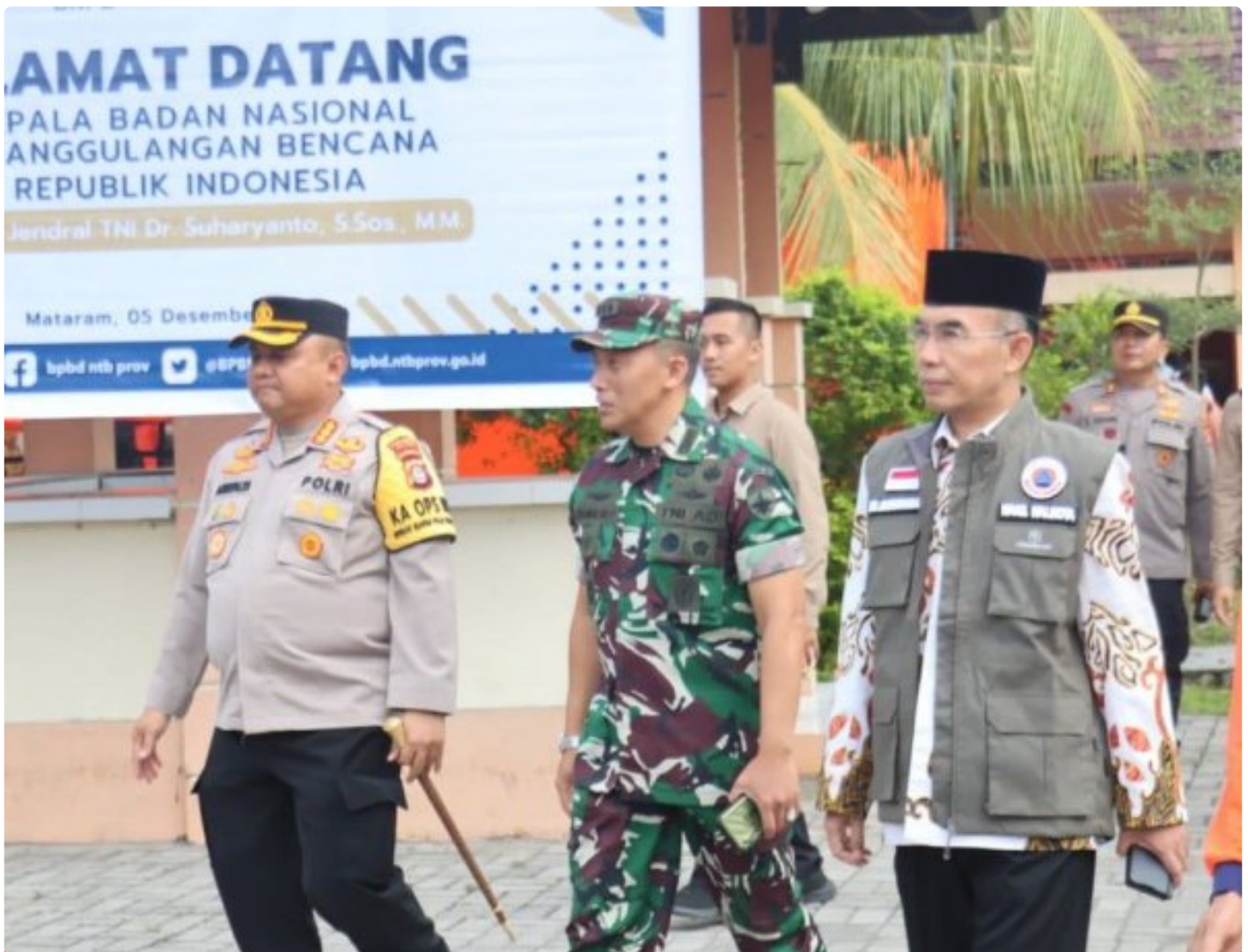
Kapolresta Mataram (Kiri) saat menghadiri acara Peletakan batu Pertama pembangunan gedung Pusdalops BPBD NTB, Kamis (05/12/2024)